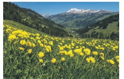
Löwenzahn im Pöschenried

Montag, 19. und 26. Juni, 20.30 Uhr im Kirchgemeindehaus