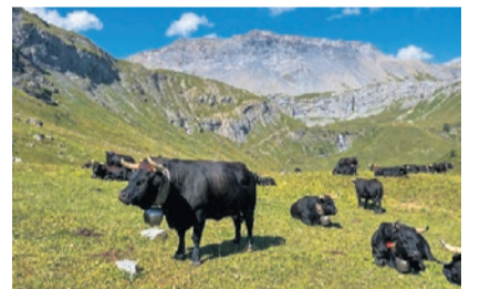
Ehringer an der Südseite des Favergesgrates.

Bildervortrag mit Ernst Zbären Montag, 3./10./17./24. und 31. Juli, 20.30 Uhr im Kirchgemeindehaus