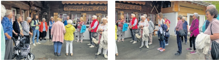
Seniorengruppe vor dem Restaurant «Chemistube»