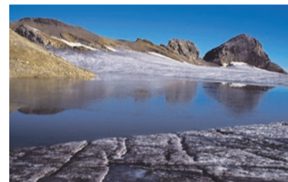
Gletscherrandsee an der Plaine Morte, Gletscherhorn

Montag, 7./14./21. und 28. August, 20.30 Uhr im Kirchgemeindehaus