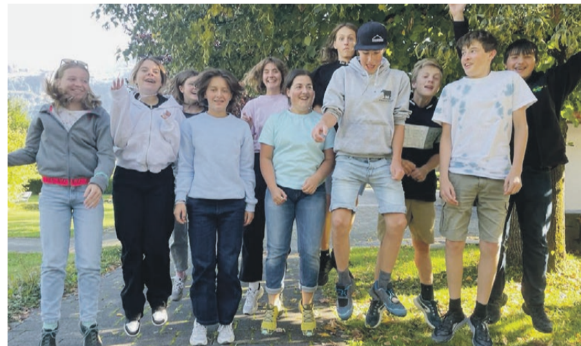
«Luftsprung» Konfirmandinnen und Konfirmanden vor dem Kirchgemeindehaus nach 5-tägigem Lager und vor dem Abschlussgottesdienst in der Kirche.

Samstag, 25. November, 9 Uhr, Unterricht im KGH