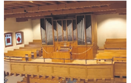
Kirchenorgel der reformierten Kirche Lenk