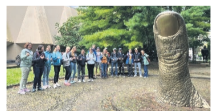
Konflager St. Maurice, Parkausstellung Fondation Pierre Gianadda, Martigny